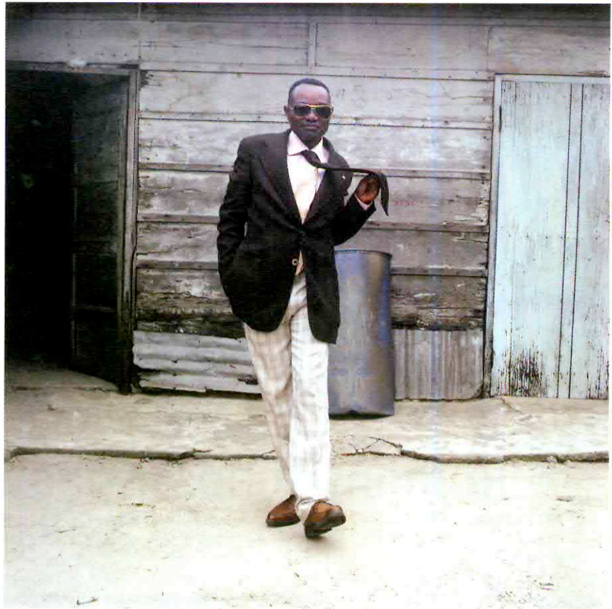
Raby a Rabyanta d'Italia